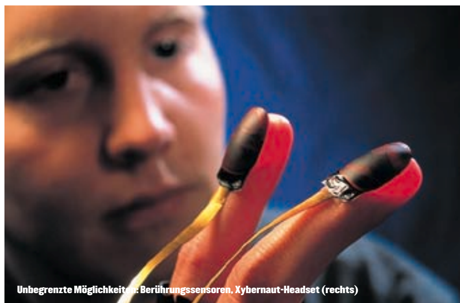
Unbegrenzte Möglichkeiten: Berührungssensoren, Xybernaut-Headset (rechts)