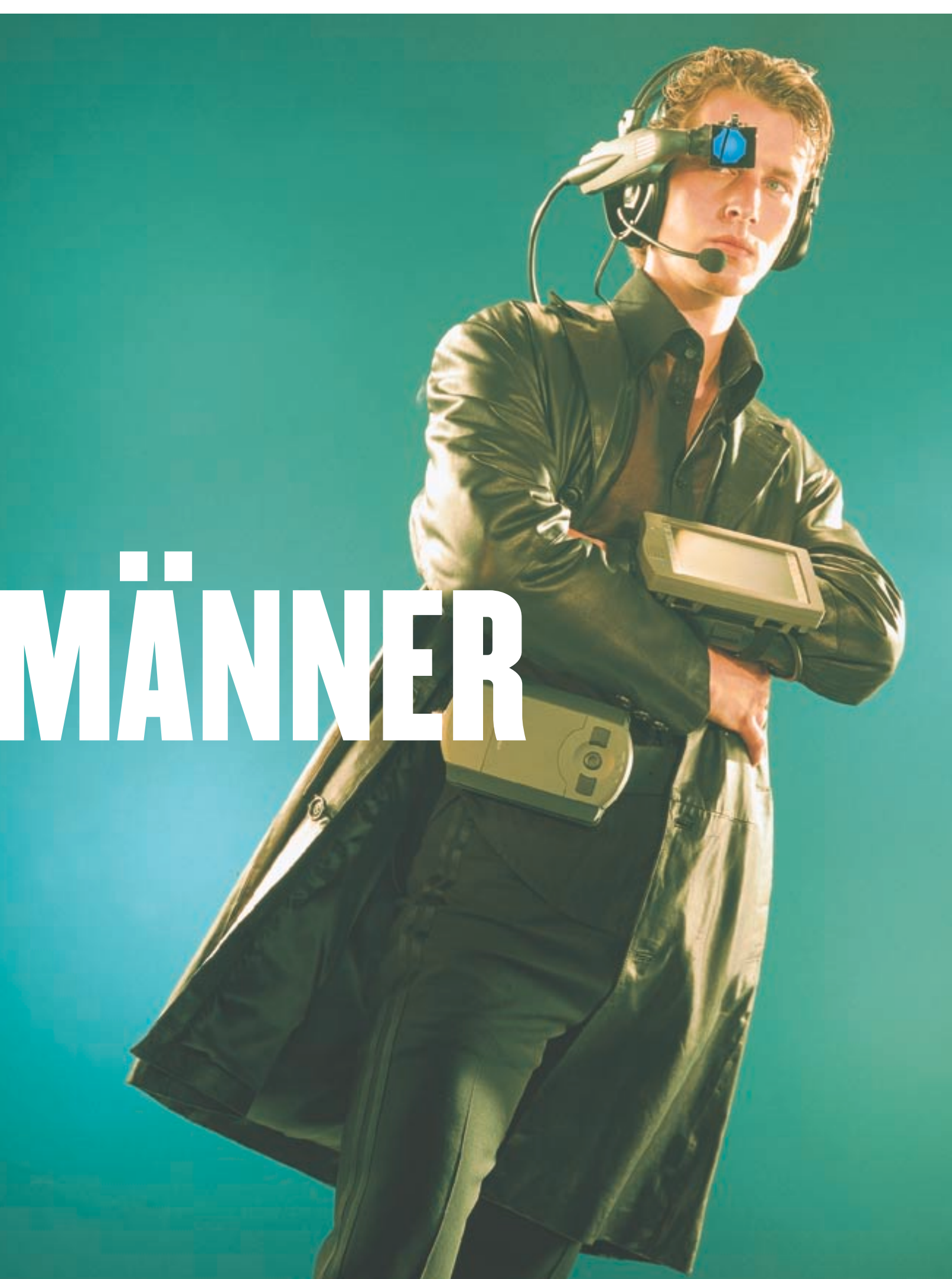
Mode: Gianni Versace/Nautilus; Modell: P. Hein