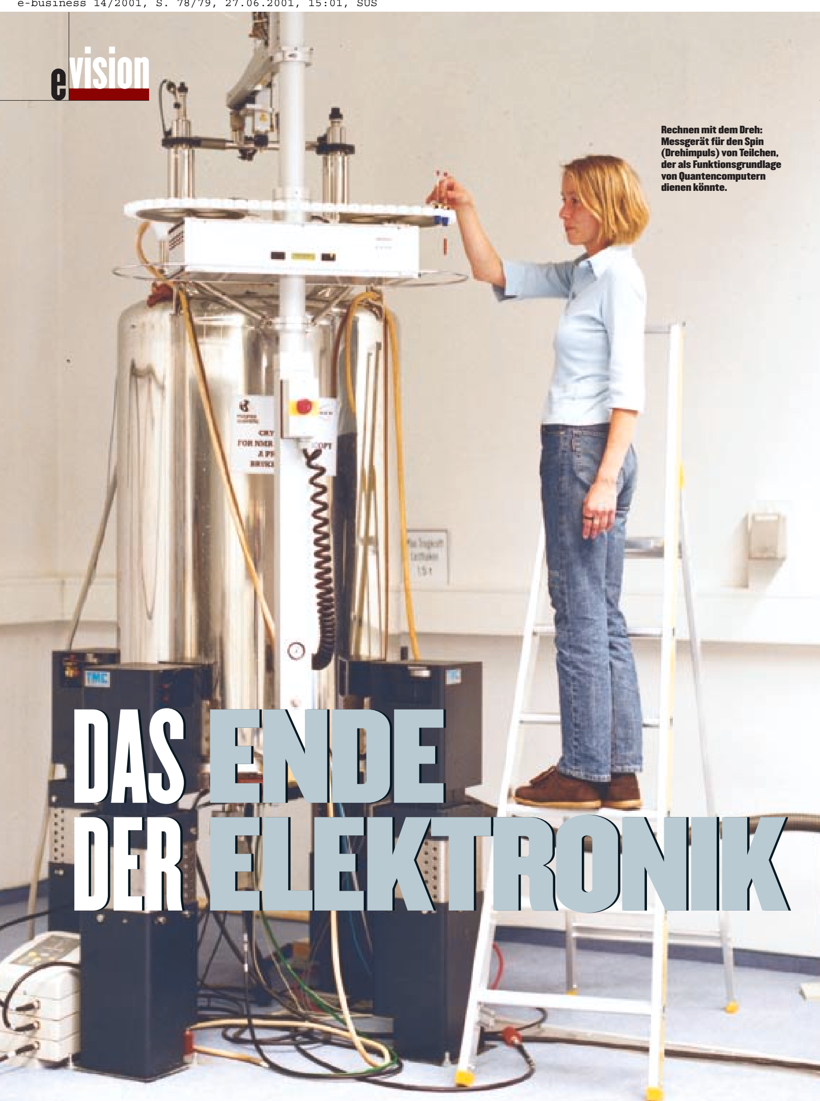
Rechnen mit dem Dreh: Messgerät für den Spin (Drehimpuls) von Teilchen, der als Funktionsgrundlage von Quantencomputern dienen könnte.